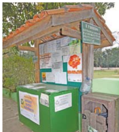
Pq. da Providência: local para descarte

Os Parques da Providência e Luiz Carlos Prestes agora têm estações para recolher computadores e outros objetos eletrônicos. O descarte desses objetos em locais apropriados é importante para evitar a contaminação do solo e do meio ambiente. A coleta é feita pela Coopermiti – cooperativa que recupera e trata resíduos sólidos eletroeletrônicos de forma ambientalmente correta. O Parque Providência fica na rua Pedro Peccinini, 88, e o Parque Luiz Carlos Prestes está localizado na rua João Della Manna, 665, ambos no distrito do Butantã.