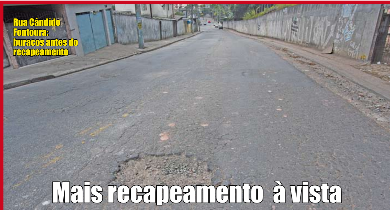
Rua Cândido Fontoura: buracos antes do recapeamento