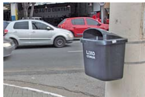
Lixeira nova instalada na avenida Vital Brasil

A pedido dos moradores da região, novas lixeiras estão sendo instaladas nos postes de importantes avenidas e também nas ruas próximas a escolas do Butantã. A colocação desses coletores visa diminuir a quantidade de lixo jogado nas ruas, melhorar a qualidade de vida dos moradores e preservar o meio ambiente. Entre as avenidas selecionadas estão a Engenheiro Heitor Antônio Eiras Garcia, no Rio Pequeno, e a Vital Brasil, no Butantã.