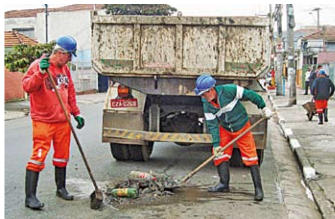
Limpeza de bueiros: manutenção diária

No mês de maio, a Prefeitura aplicou R$ 200 mil em multas devido ao desrespeito à Lei Cidade Limpa em nossa região. Também foram apreendidos mais de mil itens de propaganda irregular, como placas, faixas e panfletos. As ocorrências aconteceram nos principais centros comerciais daqui, como as avenidas Guilherme Cotching, Otto Baumgart e Conceição.