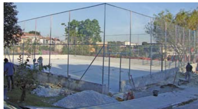
Quadra da Casa de Cultura: quase pronta

Até o mês que vem deve ser entregue a nova quadra poliesportiva da Casa de Cultura Cora Coralina. Tem piso de concreto armado, demarcação de quadra e equipamentos para futebol de salão, basquete, vôlei e handebol. Haverá cerca de tela em alambrado e de nylon na cobertura, com postes de iluminação. A reforma vem atender antiga reivindicação dos moradores da região: o piso irregular vinha provocando acidentes. A quadra fica na praça Alexander N. Aksakof, distrito de Campo Grande, bem perto da Casa de Cultura, que fica na rua Santana.