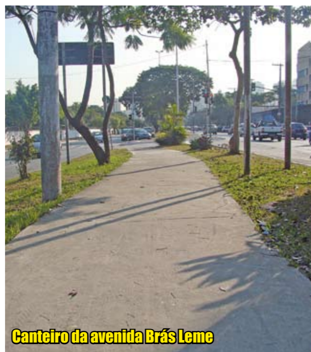
Canteiro da avenida Brás Leme

Vinte praças e canteiros de Santana, Tucuruvi e Mandaqui – como os das avenidas Brás Leme e Direitos Humanos, por exemplo – estão em obras. Estão recebendo melhorias na jardinagem e no paisagismo, além de novos espaços de convivência. Os trabalhos fazem parte do Projeto Florir, criado em parceria pelas secretarias de Coordenação das Subprefeituras e do Verde e do Meio Ambiente e executado pela Subprefeitura. A ideia é melhorar as áreas verdes da cidade com o plantio de mudas, arbustos e forração, além de reforma nas calçadas. Após a revitalização, a comunidade e as empresas podem adotar esses espaços por meio de um Termo de Cooperação. Assim, ajudam a Prefeitura a manter essas áreas verdes sempre bonitas.