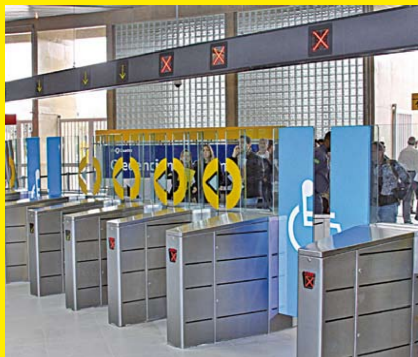
Catracas da Estação Pinheiros do Metrô

D esta vez foi tudo muito rápido. Quase ao mesmo tempo em que a estação Pinheiros da Linha 4-Amarela do Metrô abriu, ficou pronta também a passarela que faz a integração com a parada da Linha 9-Esmeralda (Osasco-Grajaú) da CPTM. Ou seja, Metrô e trens estão ligados em Pinheiros. Desde que foi aberta, em meados de maio, a estação de Metrô funciona em horário experimental, das 4h40 às 15h, mas ainda neste mês de junho começa a operar até as 24h. É só o começo. Quando o Terminal de Pinheiros ficar pronto, será melhor ainda: o usuário terá a integração do Metrô com a CPTM e os ônibus. A estação Pinheiros é a 62ª estação de todo o sistema metroviário da cidade e a quarta da Linha Amarela. As outras três em operação são Paulista, Faria Lima e Butantã. As estações República e Luz são as próximas da linha a serem abertas. Quando estiver toda pronta, a Linha Amarela vai ligar a Vila Sônia à Luz em 12,8 km de extensão e 11 estações. A estação Pinheiros fica na rua Capri, 145.