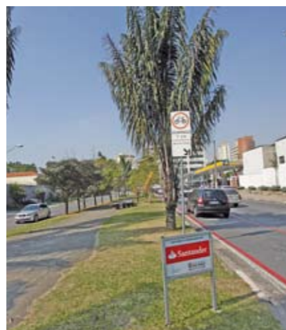
Canteiro central da avenida Hélio Pellegrino tem termo de cooperação

Mais seis áreas verdes da nossa região serão cuidadas por meio de termo de cooperação entre a Subprefeitura Pinheiros e uma empresa, o Banco Santander. O banco será responsável pela recuperação, manutenção e limpeza do canteiro central da avenida Hélio Pellegrino, entre a rua Nova Cidade e a avenida Santo Amaro, no Itaim Bibi; da avenida Henrique Schaumann, em Pinheiros; e das praças John Graz, também em Pinheiros, General San Martín, no Jardim Paulista, e Dom Gastão Liberal Pinto e Luiz Carlos Paraná, ambas no Itaim Bibi. Atualmente, 50 áreas verdes da região são mantidas por meio de termos de cooperação. Qualquer cidadão, empresa ou instituição pode adotar uma área verde. Informações pelo telefone 3095-9595.