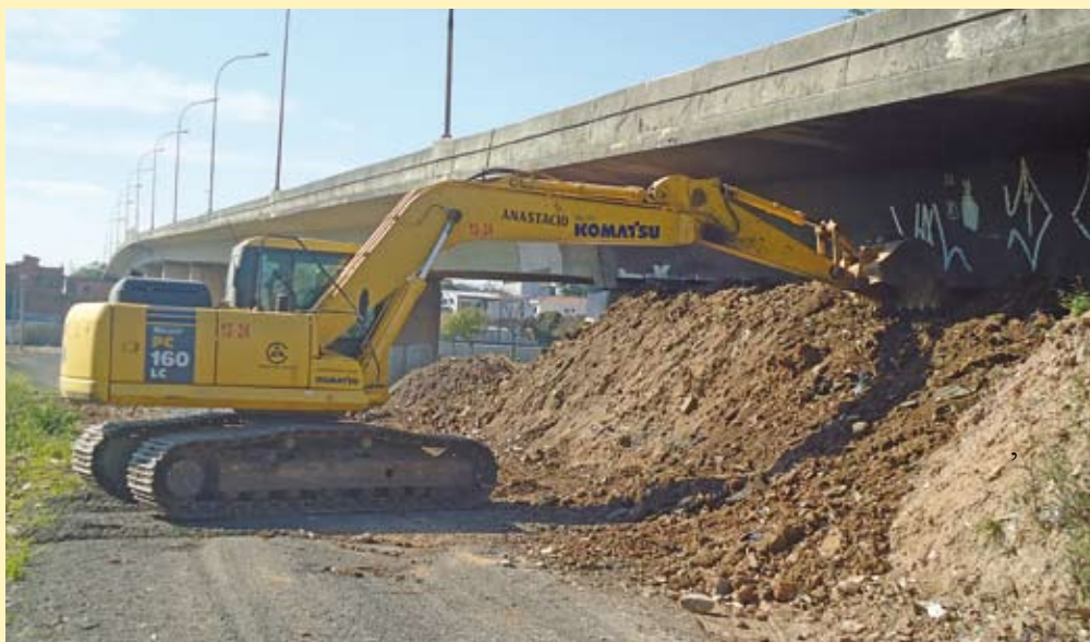
Ampliação: terraplenagem da área já começou

A té o final do ano, o Parque Linear Tiquatira vai ganhar mais 42 mil metros quadrados. A área de ampliação está localizada entre a marginal Tietê e a linha da CPTM. Atualmente com 320 mil metros quadrados, o Tiquatira é o primeiro parque linear de São Paulo. Muito frequentado pelos moradores da região, tem pista de caminhada, quiosques com mesas e bancos, bebedouros, pistas de skate, quadras, campo de futebol, anfiteatro e bosques que abrigam excelentes espaços para leitura.