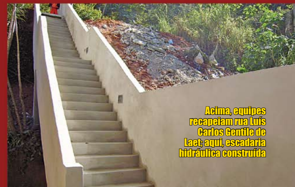
Acima, equipes recapeiam rua Luís Carlos Gentile de Laet; aqui, escadaria hidráulica construída