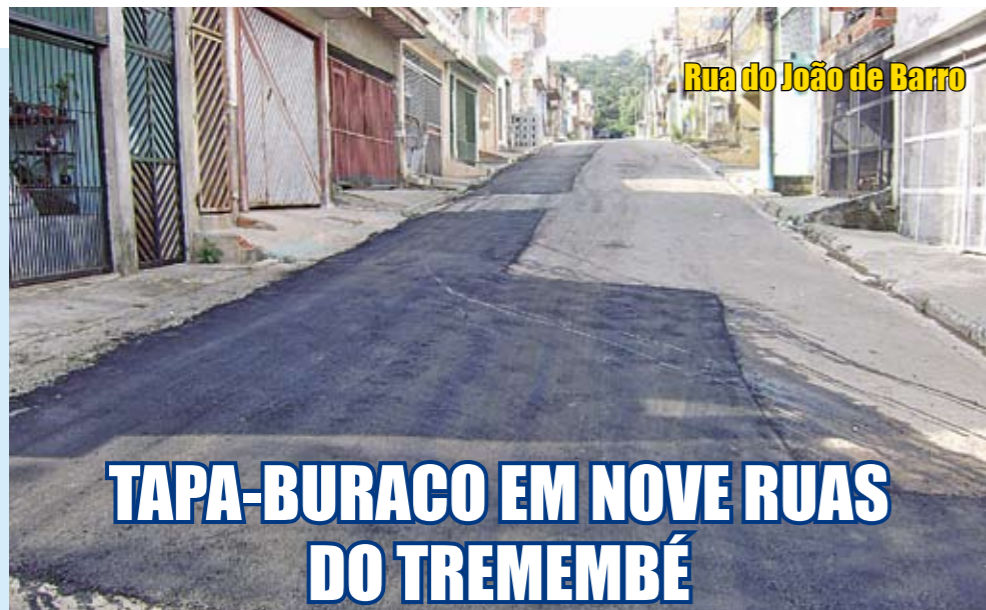
Rua do João de Barro