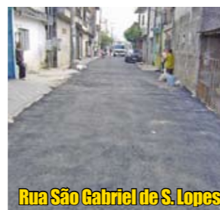
Rua São Gabriel de S. Lopes

Mais uma via ganhou asfalto novo em nossa região. É a rua São Gabriel de Souza Lopes, no Jaçanã. Essa rua fica no fim da rua Ushikichi Kamiya, na altura do km 12 da rodovia Fernão Dias, e seu trecho de 400 metros foi todo recapeado pela Subprefeitura.