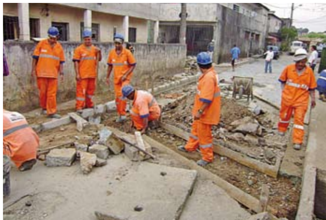
Homens trabalham na rua Elias de Almeida, no Jaçanã

A Subprefeitura Jaçanã/Tremembé está intensificando os trabalhos de remoção de veículos e carcaças abandonados nas ruas da região. Um trabalho feito pela equipe de fiscalização entre fim de maio e começo de junho apreendeu cinco veículos deixados irregularmente nas ruas. Se o dono não procurar o carro e não pagar suas dívidas, ele vai para leilão.