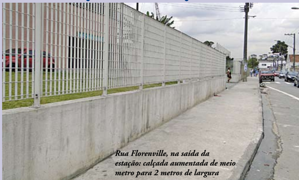
Rua Florenville, na saída da estação: calçada aumentada de meio metro para 2 metros de largura

Quem saía da estação Socorro dos trens da CPTM para a rua Florenville logo percebia: a calçada era muito pequena – tinha apenas meio metro de largura. Pela segurança dos pedestres, a Subprefeitura decidiu reformar e ampliar cerca de 200 metros de extensão na rua,