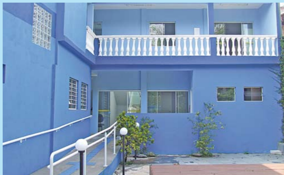
Novo prédio do CREAS: segurança e sigilo para crianças, adolescentes e mulheres

O CREAS (Centro de Referência e Assistência Social) funcionou durante anos no mesmo prédio da Subprefeitura M'Boi Mirim. Agora, o centro ganhou uma sede própria no bairro Figueira Grande. O CREAS faz o acolhimento de crianças e adolescentes em situações de risco e de proteção e para mulheres vítimas de violência doméstica, entre outras atribuições. Atualmente, a equipe conta com três assistentes sociais, uma psicóloga e uma estagiária em administração, mas a expectativa é a de que esse número aumente. O CREAS M'Boi Mirim fica rua Miguel Luis Figueira, 16, tels.: 5891-3483 / 5891-3632.