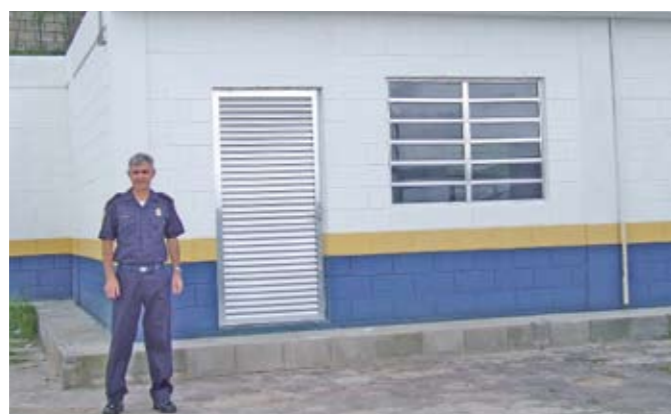
Prédio reformado da GCM: agora, tem até um auditório