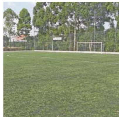
Campo de futebol do Clube da Comunidade, depois das obras

A piscina do Balneário do Ipiranga (Clube da Cidade Ipiranga) foi reaberta. O vazamento que havia ali foi solucionado e a iluminação trocada por uma mais econômica e eficiente. E as reformas continuam. A próxima etapa é a construção de três piscinas aquecidas e da cobertura da quadra. O clube oferece vários cursos cursos, entre eles tai chi chuan, natação, dança do ventre e futebol de salão. Fica na Praça Nami Jafet, 45 (esquina das ruas Cipriano Barata com Sorocabanos). Funciona de segunda a sexta-feira, das 7h30 às 20hs. O telefone de lá é 2273-1302.