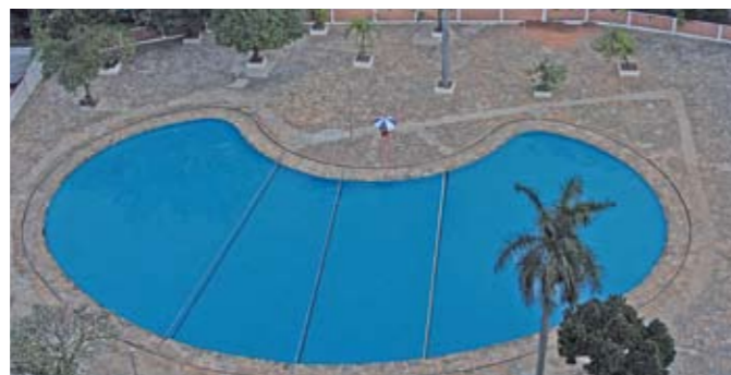
Depois da reforma, vazamento da piscina foi fechado