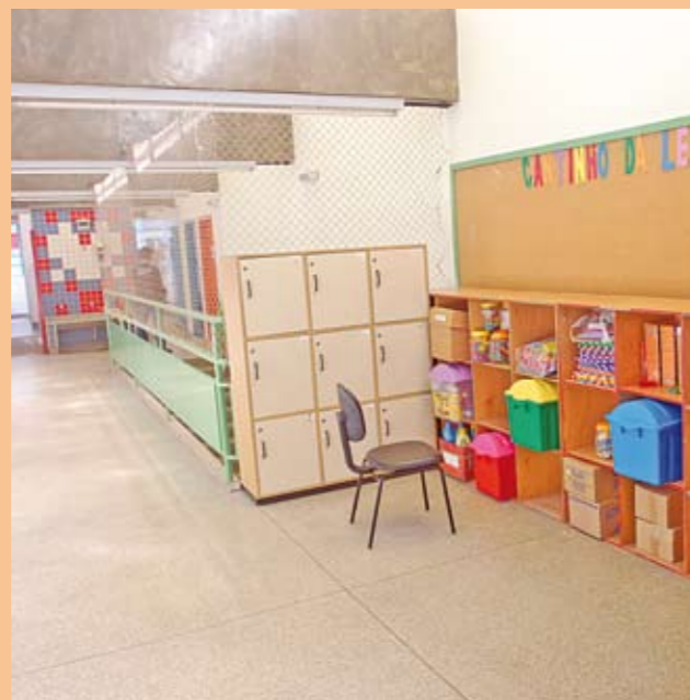
Sala de aula: pintura novinha

A cabou a reforma da EMEI Santo Dias da Silva. A escola teve os muros, salas de aula e corredores pintados. Também foi feita uma revisão no telhado e instalados rufos na fachada, para melhorar o escoamento de água da chuva e evitar infiltrações. A reforma foi feita por meio do Programa de Reforma das Escolas Municipais, criado pelas secretarias de Educação e Infra-Estrutura e Obras. Desde dezembro de 2010 a Prefeitura vem trabalhando no reparo de 505 unidades incluídas no programa. A EMEI Santos Dias da Silva fica na rua Michael Mattar, s/n, Sacomã.