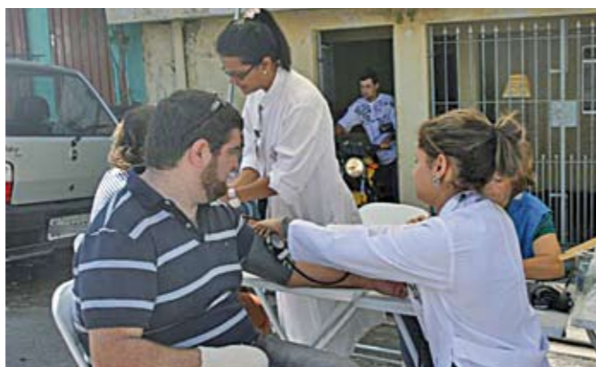
Verificação de pressão: serviços de saúde para a população