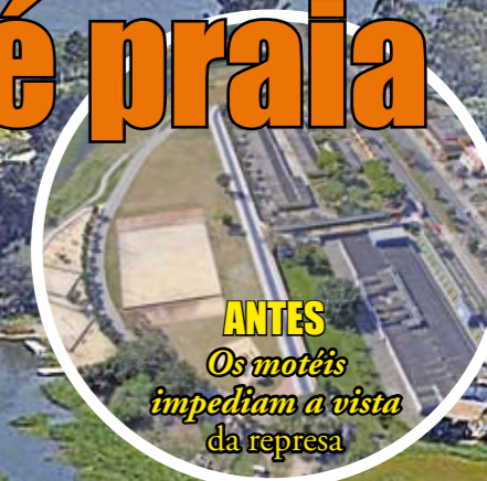
ANTES Os motéis impediam a vista da represa

Quer ter uma visão de praia, como se Capela do Socorro estivesse no Litoral? Passe pela av. Atlântica, a antiga Robert Kennedy, em direção ao bairro, e na altura do número 3.500 olhe para a direita. Você vai ver água, barcos, árvores e – o melhor de tudo – o novo Parque Praia de São Paulo, agora com 5.000 m 2 a mais. Nesse espaço, por décadas, quase 4 mil toneladas de concreto e perto de 300 metros de muro separavam as pessoas da represa. Era o motel Leão de Prata, em volta do qual situa-se o parque e também a Praia do Sol. A praia recebe, nos meses de verão, até 10 mil pessoas por dia. Assim que o motel foi demolido – com autorização judicial –, o Campeonato Internacional de Futebol de Areia recebeu mais de 30 mil visitantes. O evento foi apresentado pela TV para todo o mundo que, de quebra, mostrou a represa e o parque. A partir deste mês de maio, a Subprefeitura continua os serviços, para ampliar os jardins e áreas verdes no local.