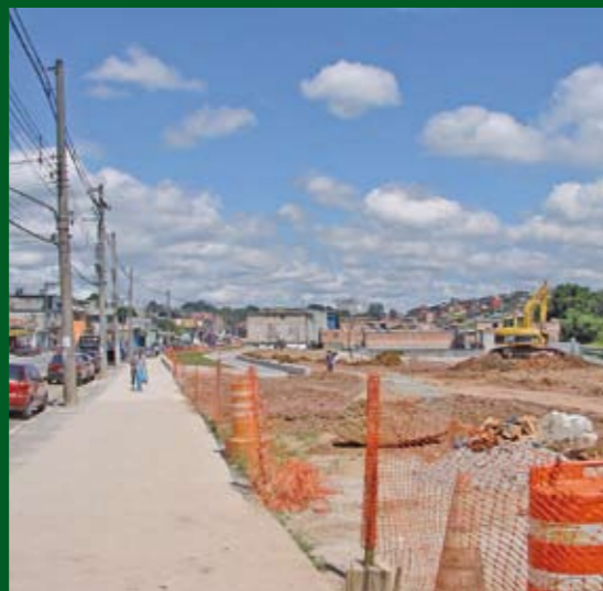
Obras no Ribeirão Cocaia: mais lazer

Na região do Jardim Mirna e Santa Cecília, distrito do Grajaú, as obras de urbanização avançam a cada dia. O córrego Ribeirão Cocaia, que corre ao lado da av. Antônio Carlos Benjamim dos Santos, está sendo canalizado no trecho urbano. E as margens, transformadas em um grande parque linear, com muito verde e espaços de lazer para a população. As obras fazem parte do Programa Mananciais, que está investindo perto de R$ 600 milhões nas margens da represa Billings, no Grajaú. Mais de 70% dos recursos são da Prefeitura de São Paulo; o restante vem dos Governos do Estado, Federal e empréstimos da Caixa Econômica Federal.