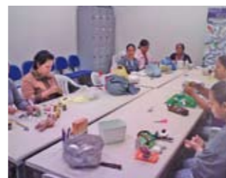
Oficina de artesanato

Voltado para o público da 3ª idade, o Projeto Felicidade é um dos programas mais queridos do CEU Vila Rubi: professores voluntários ensinam artesanato e trabalhos manuais. Promove socialização, ajuda na melhoria da autoestima e ainda dá a oportunidade de os alunos aumentarem sua renda vendendo os produtos que eles mesmos fabricam.