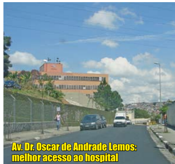
Av. Dr. Oscar de Andrade Lemos: melhor acesso ao hospital

Principal acesso ao Hospital Geral do Grajaú, a av. Dr. Oscar de Andrade Lemos, no Parque América, foi totalmente recapeada. Melhor para todos que procuram o hospital – que faz atendimento médico de urgência e emergência em clínica médica, cirurgia geral, ortopedia, obstetrícia e pediatria em toda a região. Para chegar ali, é preciso passar pela Belmira Marin e pela Jequiritiba, que também já receberam asfalto novo. A av. Oscar Lemos é, ainda, passagem para carros e ônibus que demandam os bairros da região.