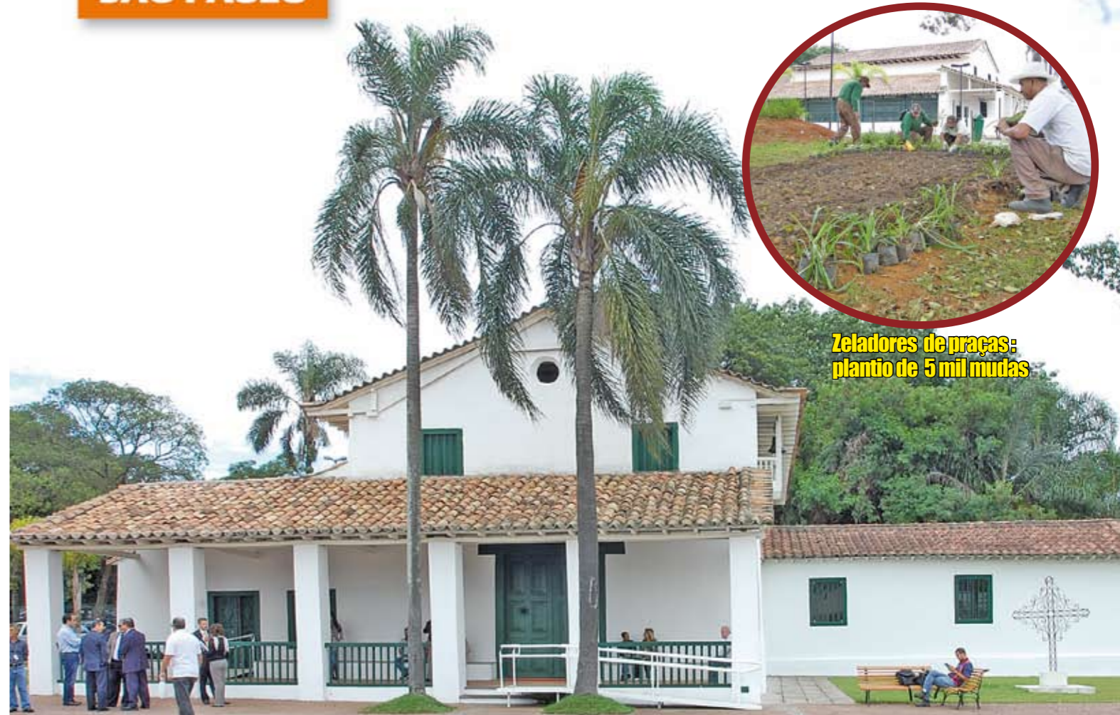
Zeladores de praças: plantio de 5 mil mudas