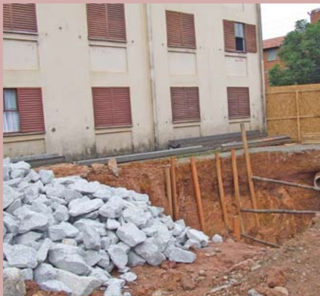
Rua José Rodrigues Maciel, perto do CDHU: sistema novo

V olume de chuvas muito grande nos últimos meses acabou solapando o sistema de drenagem da rua José Rodrigues Maciel, próximo ao conjunto do CDHU, no distrito Jardim São Luís. Sem problema: o lugar já está em obras. Será feita nova caixa de captação das águas pluviais — que recebe ramais de todas as ruas ao redor —, bem como a desobstrução das galerias entre o ponto de rompimento até o final, no braço afluente do córrego Ponte Baixa. Com a reforma, a capacidade de captação de águas será ampliada, garantindo a segurança da população. O prazo da obra é de seis meses.