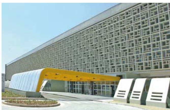
Hospital M'Boi Mirim: um novo marco em apenas dois anos

AS NOTÍCIAS DO BAIRRO NO SEU E-MAIL Você quer receber todos os meses, por e-mail, o Aqui M'Boi Mirim ? Escreva em qual bairro você mora para o e-mail aquinoticiascidade@prefeitura.sp.gov.br