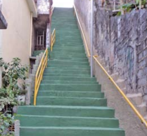
Rua Ida Maia Carvalho