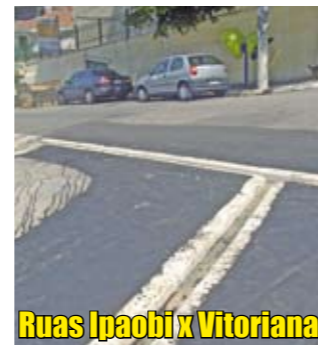
Ruas Ipaobi x Vitoriana

Há um novo sarjetão no cruzamento das ruas Ipaobi e Vitoriana, no Jardim Oriental (foto). Os sarjetões ajudam a escoar as águas das chuvas. Agora, as águas vão incomodar menos tanto motoristas quanto pedestres. Desde 2005, a Subprefeitura reconstruiu 3.380 metros de sarjetões.