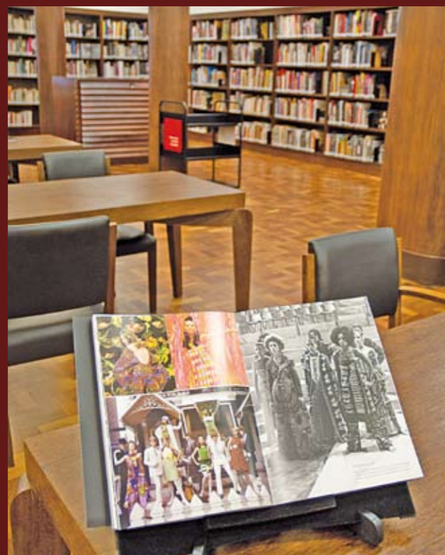
Sala das Artes: um dos ambientes visitados

Quem tem curiosidade em conhecer a riqueza do acervo guardado nos 22 andares da Biblioteca Mário de Andrade pode participar das visitas guiadas que são oferecidas ali. Acontecem às terças e quintas, às 11h e 15h. Para participar, é preciso fazer reserva pelo telefone 3256-5270, ramal 206. As visitas duram uma hora e passam pelas salas de Artes, Mapoteca, Obras Raras e Especiais, Coleção Geral, Atualidades e Circulante. A Biblioteca Mário de Andrade foi reaberta em janeiro, depois de três anos em reforma. É a segunda maior do Brasil, a primeira é a Biblioteca Nacional, do Rio.