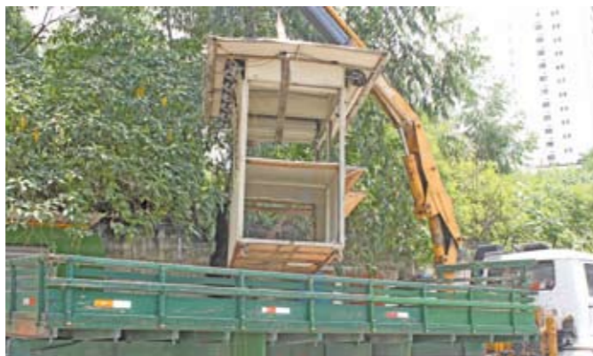
Bancas notificadas: no fim do prazo, recolhimento

Em operações para proteger a população da venda de produtos alimentícios irregulares, sem origem comprovada, a Subprefeitura apreendeu doces, cigarros e bebidas alcoólicas. Em conjunto com a Guarda Civil Metropolitana (GCM), as operações removeram bancas instaladas nas calçadas nas ruas Laerte Seetúbal e José Augusto de Souza, na área do distrito Vila Andrade. Antes da apreensão e remoção, os ambulantes irregulares foram notificados, mas não cumpriram prazo para regularização. No fim do prazo, começou a operação.