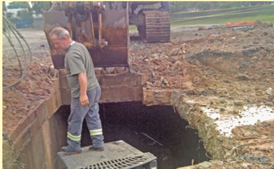
Rua Conrad Faber: tubulação bloqueada por sujeira e concreto, toda reformada

As galerias de águas de seis importantes ruas da região passaram por um detalhado trabalho de manutenção e limpeza: Celorico de Basto, Letícia, Ceresópolis, Miguel Varca, Januário da Cunha Barbosa e Conrad Faber. Foi dada atenção especial à desobstrução de galeria subterrânea na rua Conrad Faber, próxima da Associação Atlética Banco do Brasil, no Jardim Germânia, distrito Campo Limpo. Ali, foram instalados 110 metros de galeria tubular e duas linhas de tubos de 4 metros de diâmetro e 2,10 metros de altura. Tudo para dar vazão ao córrego do local e eliminar um ponto de alagamento.