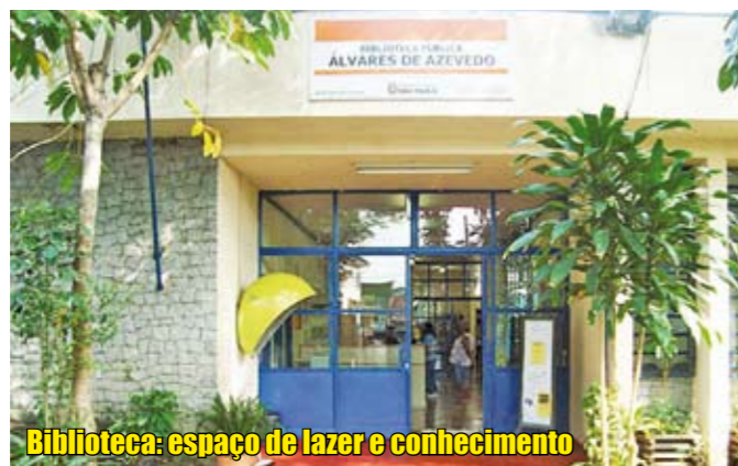
Biblioteca: espaço de lazer e conhecimento

No dia 20 de março, às 11h, a Biblioteca Álvares de Azevedo vai levar ao público infantil a peça Ciranda das Flores, encenada pela Companhia Prosa dos Ventos. O espetáculo conta a história do amor não declarado entre um sementeiro e uma jardineira. Tudo vai muito bem entre eles até que, um dia, acabam brigando por causa de um cacto. O que eles não imaginavam é que esse é o ponto de partida para o surgimento de mistérios e surpresas que ultrapassam os limites da realidade. A peça, com duração de 45 minutos e entrada gratuita, sem limite de ingressos, é recomendável para crianças a partir de 3 anos. A Biblioteca Álvares de Azevedo fica na Praça Joaquim José da Nova, s/n, na Vila Maria Alta.