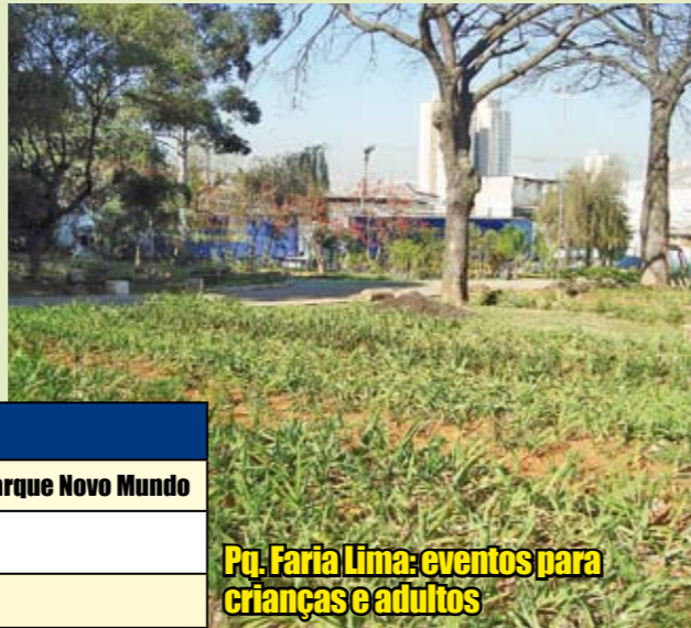
Pq. Faria Lima: eventos para crianças e adultos

No dia 22 de março, comemora-se o Dia Mundial da Água. Para celebrar a data e despertar o uso consciente desse bem natural, o Núcleo Norte 2, ligado à Secretaria do Verde e do Meio Ambiente, com o apoio da Subprefeitura de Vila Maria/Vila Guilherme, vai realizar o evento As águas vão rolar! , em três parques da zona Norte, dos dias 22 a 25 de março, a partir das 13h30. Basta chegar! Para as crianças foram preparadas diversas atividades recreativas e educativas, ensinando que cuidar do planeta é tarefa que se aprende desde cedo. Já para os adultos, serão desenvolvidas trilhas dentro do parque com o objetivo de despertar a consciência sobre a importância da água para a manutenção dos espaços verdes da cidade.