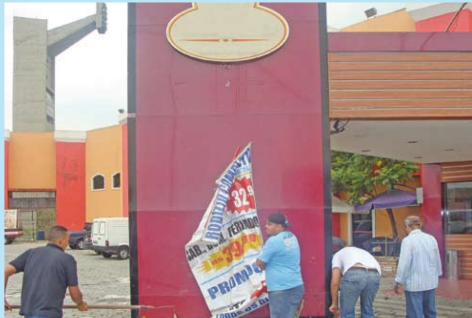
Blitz de fiscalização retira anúncio irregular

A Prefeitura está intensificando a fiscalização do cumprimento da Lei Cidade Limpa. Um grupo de operações especiais acaba de ser criado para dar apoio às Subprefeituras neste trabalho. Esta equipe, ligada à Coordenadoria das Subprefeituras, atua na cidade inteira, organizando e realizando operações de fiscalização como a realizada em fevereiro, quando, em um único dia, os fiscais multaram 136 infratores nas regiões de sete Subprefeituras. Aqui na Mooca, foram oito multados. O grupo especial é um importante reforço de fiscalização. Somente no ano passado a Subprefeitura retirou mais de 4.800 anúncios publicitários que não respeitavam a Lei Cidade Limpa.