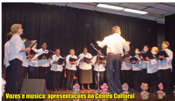
Vozes e música: apresentações no Centro Cultural

Estão abertas inscrições para oficinas culturais e esportivas no Centro Cultural Jabaquara, perto da estação terminal do Metrô, na rua Arsênio Tavolieri, 45. Pode escolher: há vagas para oficinas de artesanato, capoeira, roteiro de cinema, teatro para jovens e adultos, dança do ventre, teatro e ginástica para a 3ª idade e ginástica para gestantes. Contato pelo telefone 5011-2421. É tudo gratuito; as aulas começam dia 15 de março. Além das oficinas, o Centro Cultural oferece programação fixa de eventos. No ano passado, 33 mil pessoas assistiram às atividades, em 170 apresentações.