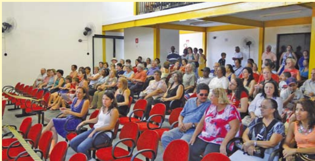
O auditório do anfiteatro da Casa de Cultura Salvador Ligabue, no Largo da Matriz

Os frequentadores da Casa de Cultura Salvador Ligabue, na Freguesia, acabam de ganhar um anfiteatro novinho. O local abriga um auditório com capacidade para 110 pessoas, com mezanino, e pode ser usado para shows, eventos, oficinas e apresentações. Lá, há também três salas para cursos. A obra, da Subprefeitura, fez parte da ampliação da Casa de Cultura, que fica no Largo da Matriz, 215. O funcionamento é de terça a domingo, das 9h às 18h, e o telefone é 3931-8266.