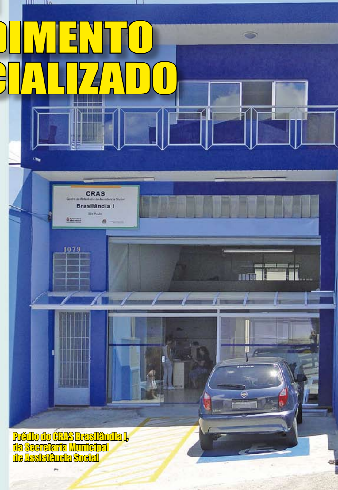
Prédio do CRAS Brasilândia I, da Secretaria Municipal de Assistência Social

Nossa região acaba de ganhar uma nova unidade do Centro de Referência de Assistência Social. É o CRAS Brasilândia I, a 20ª unidade com sede própria na cidade e a quarta da zona Norte. O objetivo é atender famílias em situação de risco e vulnerabilidade social, oferecendo benefícios como a Carteira do Idoso para o transporte interestadual, inclusão nos programas de transferência de renda como o Bolsa Família, o Renda Mínima e Cidadã, além de acolher, dar apoio, orientação e fazer o encaminhamento de quem precisa para a rede assistencial. O local tem 216 m² de área construída, salas para atendimento individual e para famílias, espaço para crianças e quatro banheiros. Uma equipe composta por assistentes sociais e psicólogos está preparada para atender as pessoas. O CRAS Brasilândia I fica na Estrada Lázaro Amâncio de Barros, 1.079, no Jardim Guarani. Funciona de segunda a sexta-feira, das 8h às 18h.