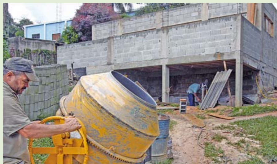
CAPs em construção: atendimento especializado para pacientes de saúde mental