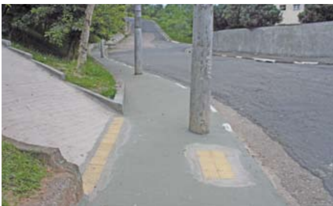
Passeio da escola Prof. Palimércio de Rezende: dentro da lei.

A multa para quem não tem passeios em ordem varia de R$ 96,33 a R$ 192,66 por metro linear de piso danificado. A multa é reemitida a cada 30 dias até que a calçada seja reformada para garantir a segurança dos pedestres.