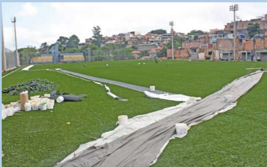
Colocação de grama sintética no CDC Jardim Poringá: melhorias para o lazer.

Foram feitas reforma em regra: revisão das instalações elétricas e hidráulicas; drenagem no campo de futebol; recuperação da sede social e da quadra de esportes. Até o alambrado foi substituído. Além de receber iluminação para jogos noturnos, o CDC Poringá terá grama sintética. E, agora, a quadra do Esporte Clube Sapy é coberta. O Poringá fica na rua Francisco Soares, 12, no Jardim Ingá. O Sapy, na Manoel Grandini Casquel, 20, Jardim Catanduva. Os dois ficam no distrito de Campo Limpo.