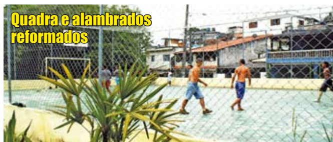
Quadra e alambrados reformados