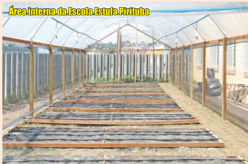
Área interna da Escola Estufa Pirituba

Nossa região foi uma das quatro da capital que receberam uma unidade da Escola Estufa Lucy Montoro neste início de ano. Antes, já funcionavam na cidade outras quatro, inauguradas pela Secretaria Municipal de Participação e Parceria. Esses espaços oferecem cursos e vivência em horticultura, produção de mudas de árvores nativas, espécies para paisagismo e atividades agrícolas. O curso Frutos da Terra: por uma Cidade Sustentável dá noções de plantio, cultivo e colheita de hortaliças para quem quer trabalhar com isso, além de ensinar sobre nutrição, segurança alimentar e empreendedorismo. Os interessados devem se inscrever pelos telefones 3113-9629/9683. A Escola Estufa Pirituba fica na Travessa Lázaro Merono, 123.