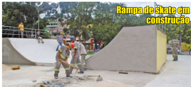
Rampa de skate em construção

A Subprefeitura está trabalhando para garantir a diversão de crianças e jovens da nossa região. No Parque Panamericano, no Jaraguá, a praça Antonio Calegaris, que fica na rua Josefa Fontoura, está recebendo escorregadores, gangorras, balanços duplos e uma casinha para as crianças brincarem. A quadra que existe ali foi reformada, assim como o alambrado. No Jardim São José, em Pirituba, a praça Monsenhor Escrivá, que fica na avenida Fuad Luftala, vai ganhar uma pista de skate, onde os fãs deste esporte podem praticá-lo com segurança.