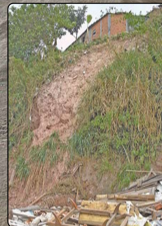
O morro da Espinhel concretado e antes da obra: sem riscos

A té pouco tempo atrás, morar ou andar pela rua Espinhel, no Jardim Elba, distrito de Sapopemba, era uma aventura. Principalmente em dias de chuva. Era grande o risco de desabamento do barranco, que ocupa toda a extensão de um dos lados da rua. Por isso, a Prefeitura investiu R$ 1,2 milhão na obra de contenção. Primeiro, foi retirada toda a cobertura vegetal. Depois, instalou-se uma tela metálica, com malha quadriculada, bem fixada por barras de aço. Em seguida, cobriu-se toda essa malha com uma manta de concreto. Essa armação concretada que reveste o morro garante a impermeabilização do solo, evitando o risco de desabamento em qualquer ponto da encosta. Para completar, foi feita uma escada hidráulica, uma grande calha de concreto com degraus, que conduzem a água da chuva para o sistema de drenagem. Além de impedir que a água se infiltre no alto do morro amolecendo o solo e provocando o deslizamento, a escada diminui a velocidade da enxurrada, evitando riscos para pedestres e construções. É mais segurança para as casas localizadas no alto do morro, nas laterais e do outro lado da estreita rua Espinhel.