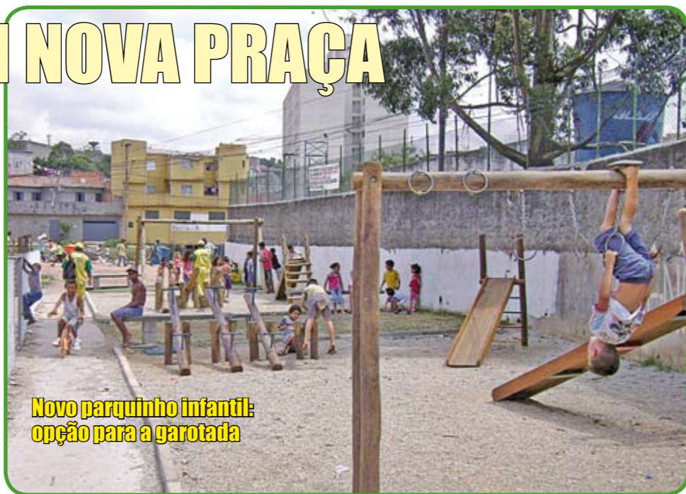
Novo parquinho infantil: opção para a garotada

A rua Glauber Rocha, no Sapopemba, acaba de ganhar uma praça no lugar de um antigo depósito de entulho. Depois de limpa e gramada, a área recebeu mesas para jogos de dama e xadrez, bancos, brinquedos e equipamentos para pessoas da terceira idade se exercitarem. É mais um espaço de lazer para todas as idades.