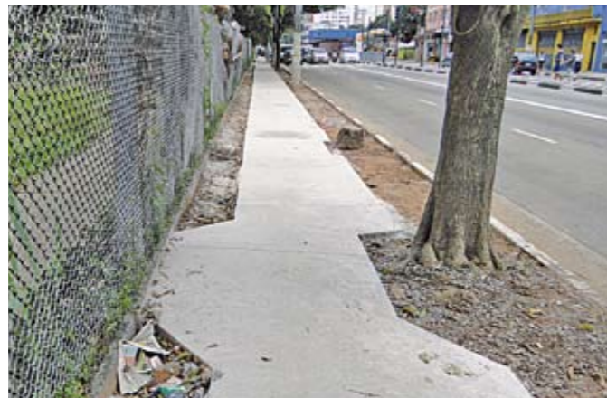
Em obras: as calçadas vão facilitar a passagem dos pedestres