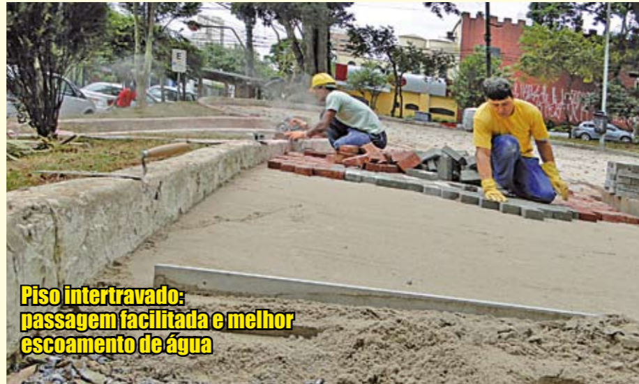
Piso intertravado: passagem facilitada e melhor escoamento de água

Entre as ruas Estilo Barroco, Antônio das Chagas, Américo Brasiliense, da Paz e avenida Santo Amaro, no distrito de Santo Amaro, há uma praça que temporariamente não pode ser utilizada. É a praça Rui Amorim Cortez, que está em obras. O piso de antigo de concreto, que dificultava a passagem, está sendo substituído por 900 m 2 de blocos de concreto intertravado. Também será feito novo paisagismo – além das 52 árvores já existentes no local, mais 5.400 mudas de agapanto e a mesma quantidade de piléa; 4.500 mudas de amendoim rasteiro e 635 m 2 de grama esmeralda. E a praça vai ganhar lixeiras e bancos. Vale a pena esperar para ver.