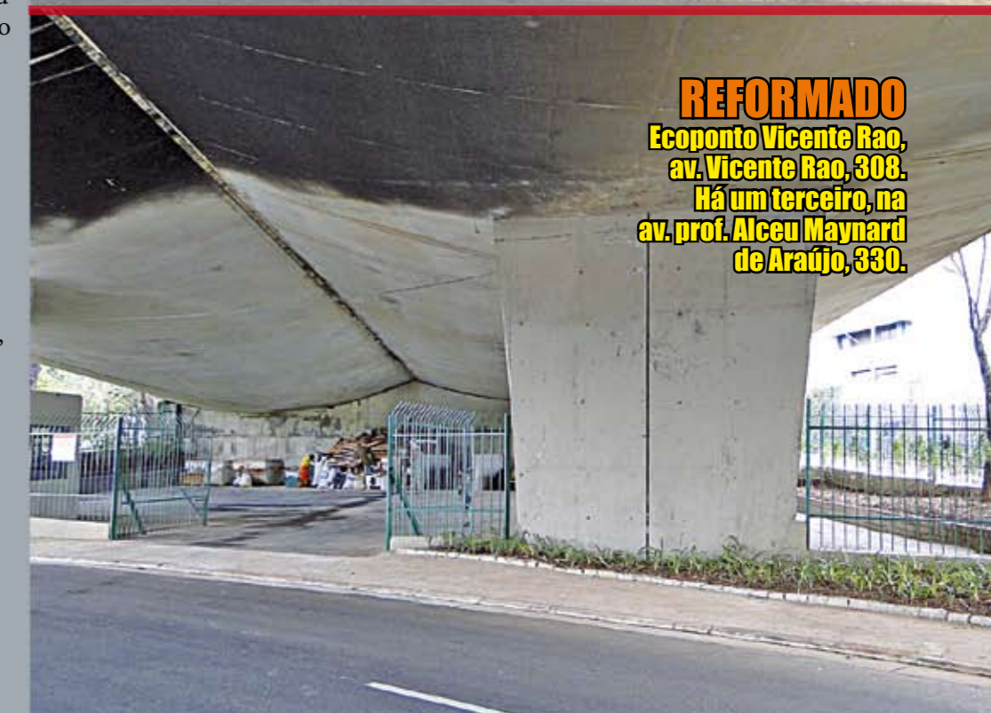
REFORMADO Ecoponto Vicente Rao, av. Vicente Rao, 308. Há um terceiro, na av. prof. Alceu Maynard de Araújo, 330.