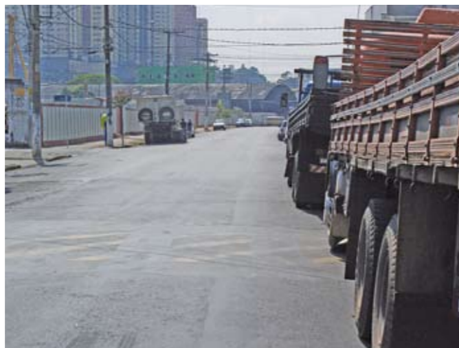
Rua da Balsa: em breve, mais 140 metros de asfalto novo

Você sabia que deixar a calçada mal conservada, como na foto abaixo, dá multa? Em 2010, só na nossa região, foram aplicadas 167 multas e feitas 560 notificações (que dão até 30 dias para o morador ou o comerciante fazer a reforma). O valor da multa varia de R$ 96,33 a R$ 192,66 por metro linear de calçada danificada, sendo reemitida a cada 30 dias até que o passeio seja refeito. A medida é importante para deixar a cidade segura para todos que vivem aqui.