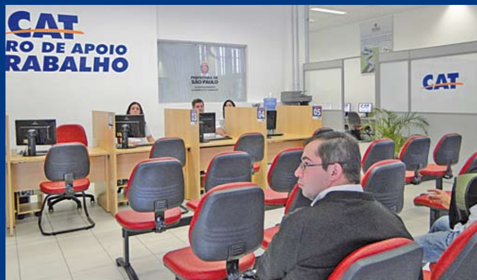
O novo CAT Parelheiros: no mesmo prédio da Subprefeitura

Com capacidade para atender 100 pessoas por dia, o Centro de Apoio ao Trabalhador (CAT) Parelheiros, inaugurado em dezembro, vai facilitar – e muito – a vida dos moradores da região. Ninguém vai mais percorrer os 10 km até o CAT Capela do Socorro para tentar emprego. Aqui, há todos os serviços: orientação, cursos e ofertas de empregos. O CAT Parelheiros fica na av. Sadamu Inoue, 5.252 (Subprefeitura). Atendimento de segunda a sábado, das 8h às 17h. Para saber mais, acesse o portal da Prefeitura: www.prefeitura.sp.gov.br .