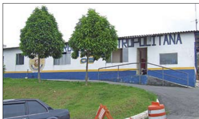
Base da GCM na avenida Tuparoquera: melhores condições