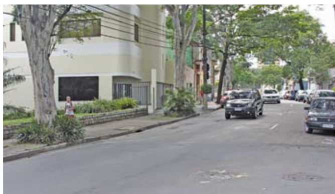
Rua Coriolano: 2,1 km serão recapeados

Mais conforto para quem gosta de circular de bicicleta pela região: acabam de ser instalados em toda a Lapa 170 paraciclos, equipamentos próprios para estacionar bicicletas com segurança. O Clube Pelezão, a Subprefeitura Lapa, o Mercado Municipal e o Parque da Água Branca são alguns dos 34 locais que receberam paraciclos. A lista completa pode ser consultada no site www.prefeitura.sp.gov.br/cidade/secretarias/subprefeituras/lapa/ .