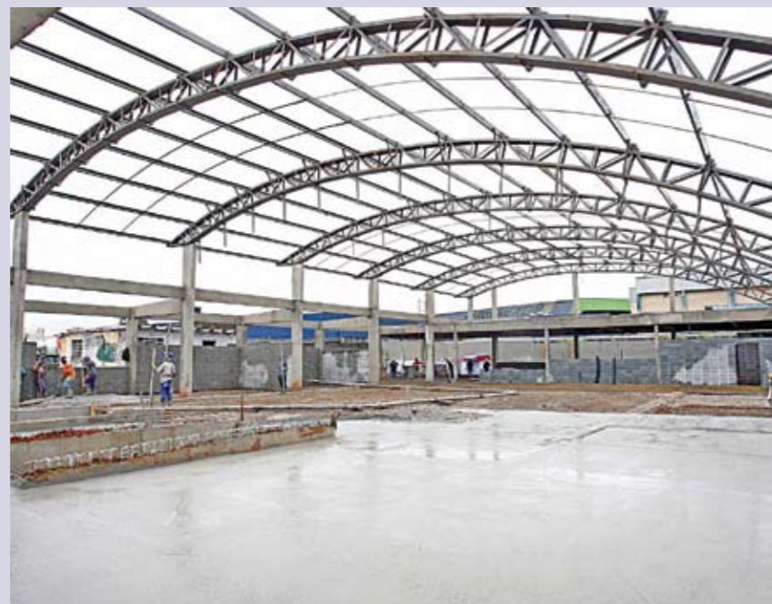
Galpão: construção está em ritmo acelerado

Um novo galpão está sendo construído para abrigar a Unidade de Tratamento de Resíduos Sólidos e a Cooper Viva Bem, cooperativa que faz parte do Programa Socioeconômico de Coleta Seletiva da Prefeitura. No novo espaço, os cooperados vão receber, separar e dar destino correto para materiais recicláveis como vidro, papel, plástico e metal. Enquanto o galpão não fica pronto, a Cooper Vivabem funciona provisoriamente em um espaço na Vila Leopoldina. O novo galpão vai oferecer condições de trabalho muito melhores. Haverá esteiras, prensas e outros equipamentos utilizados para facilitar a separação e encaminhamento do material. O galpão será equipado também com banheiros, vestiários e refeitório. A nova unidade está sendo construída por meio de um convênio entre a Prefeitura e o Governo Federal. Fica na avenida Castello Branco (Marginal Tietê), 7.729, próximo à ponte Júlio de Mesquita Neto.