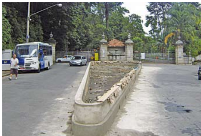
Rotatória construída na frente do Horto: trânsito mais organizado

Os moradores do Tremembé acabam de ganhar mais um local para praticar esportes. Terminou a construção da quadra do Clube da Comunidade (CDC) Ovídio Bello, que pode ser usada por quem quer jogar basquete, vôlei, handebol e futsal. A quadra foi cercada por alambrados e ganhou tela de cobertura. O CDC Ovídio Bello fica na rua Capitão José Aguirre de Camargo, 410, na Vila Albertina.