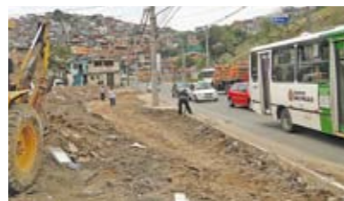
Baia: obras terminam este mês

Via de trânsito pesado na região, a avenida Deputado Cantídio Sampaio está recebendo uma baia de recuo (foto) na altura do número 4.000, na Brasilândia, para organizar a parada de ônibus no local. Com ela, o embarque e o desembarque de passageiros ficam mais seguros, fora da pista, liberando a circulação de veículos na avenida. A obra começou em novembro e deve terminar este mês. Este mesmo trecho da avenida foi recapeado em cerca de 500 metros no fim do ano passado.