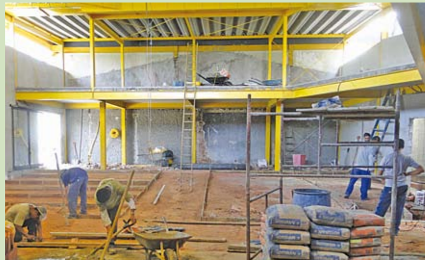
Homens trabalham na ampliação da Casa de Cultura, no Largo da Matriz

Já está em curso a segunda etapa de uma obra muito aguardada pelos moradores da Freguesia do Ó: a ampliação da Casa de Cultura Salvador Ligabue, no Largo da Matriz. Está sendo construído pela Subprefeitura, em uma área anexa à que estava desativada, um auditório com mezanino e capacidade para receber mais de 100 pessoas, além de salas multiuso e camarins. A obra deve terminar até o meio do ano. A primeira etapa, que contemplou a parte estrutural da Casa de Cultura, foi feita em novembro de 2009. E já estão abertas as inscrições para oficinas gratuitas no local, como dança de salão, capoeira, desenho, balé, tai chi chuan e teatro. Informações pelo telefone 3931-8266.