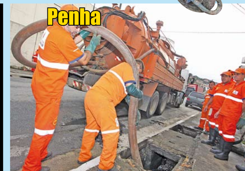
Limpeza mecanizada de galeria na rua Dona Joaquina Santana