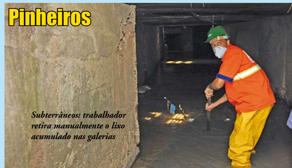
Subterrâneos: trabalhador retira manualmente o lixo acumulado nas galerias

O lixo jogado nas ruas não entope só os bueiros, mas também os piscinões construídos para absorver o excesso de água das chuvas