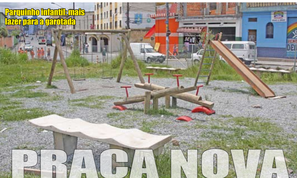
Parquinho infantil: mais lazer para a garotada