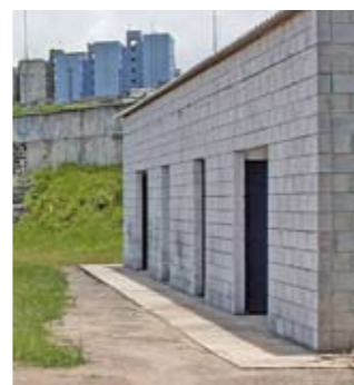
Vestiários do campo de futebol: obras na reta final