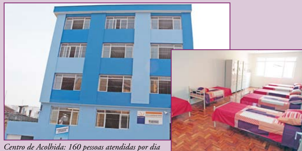
Centro de Acolhida: 160 pessoas atendidas por dia

banheiros, nove deles com chuveiros e um adaptado para deficientes. No Centro, os abrigados têm direito a banho, jantar e café da manhã. Também são atendidos por uma equipe com profissionais de várias áreas, que colocam à disposição deles todos os serviços da rede sócio-assistencial, como inclusão em programas de transferência de renda, capacitação para o mercado de trabalho e regularização de documentos, entre outros.