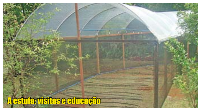
A estufa: visitas e educação

Está precisando de dinheiro para iniciar ou ampliar o seu pequeno negócio? Então essa notícia é para você. O São Paulo Confia, banco de microcrédito de São Paulo, acaba de aumentar o limite para concessão de empréstimos. Para quem vai pegar o empréstimo pela primeira vez, o valor subiu para R$ 1.800. Para os que já são atendidos pelo sistema, o valor de novos empréstimos agora pode chegar até a R$ 9 mil. A agência do São Paulo Confia de nossa região fica na av. do Oratório, 172, Jardim Independência, distrito de Vila Prudente.