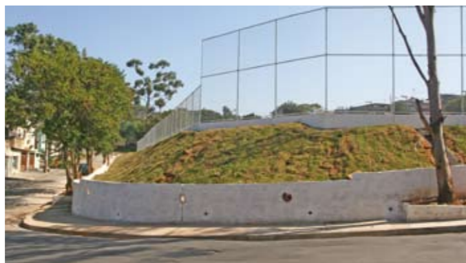
Rua Umari: muro refeito e alambrado instalado

Nas ruas Umari e Veratro, o muro de arrimo em torno do campo usado pelo Clube Desportivo Municipal Faria Lima foi substituído por outro. Também foi colocado um alambrado de 4,5 metros de altura em parte do campo. Na rua Veratro, o terreno foi regularizado para receber a pavimentação em concreto e as guias e sarjetas danificadas foram consertadas.