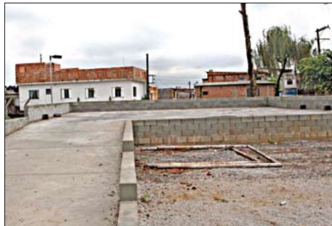
Obras do EcoPonto da Juta: quarta unidade da região