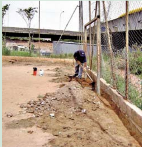
Obras na quadra: preparação para piso novo

Em breve, quem costumava usar a área de lazer que fica embaixo do Viaduto Grande São Paulo vai ganhar um espaço renovado. O local, conhecido como Praça Orlandia, está em reforma. As benfeitorias incluem a reforma das muretas ao redor da quadra, substituição das telas do alambrado e da tela superior que encobre a quadra e pintura dos tubos. O piso da quadra também será totalmente renovado e demarcado. Serão instaladas novas traves e tabelas de basquete. Para evitar que a quadra fique inundada na época de chuvas, será feito um sistema de canalização para drenagem das águas pluviais. O roteiro de benfeitorias inclui ainda a melhoria paisagística do local. Por fim, o Departamento de Iluminação Pública da Prefeitura (Ilume) está estudando o sistema de iluminação da praça.