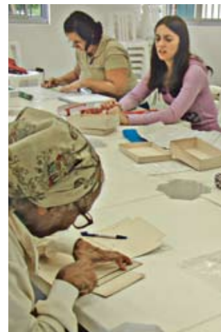
Artesanato: ainda há vagas

Está com tempo livre e vontade de aprender algo novo? Faça um dos cursos oferecidos pela nossa Supervisão de Cultura. As aulas já começaram, mas alguns cursos ainda têm vaga e aceitam inscrições, como os de artesanato, origami, dança de salão e violão. Não tem limite de idade, de jovens a idosos, todos podem participar. As inscrições podem ser feitas pessoalmente, na Subprefeitura, na avenida do Oratório, 172.