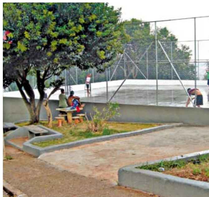
Praça Humberto Reis Costa: quadra em lugar do campinho