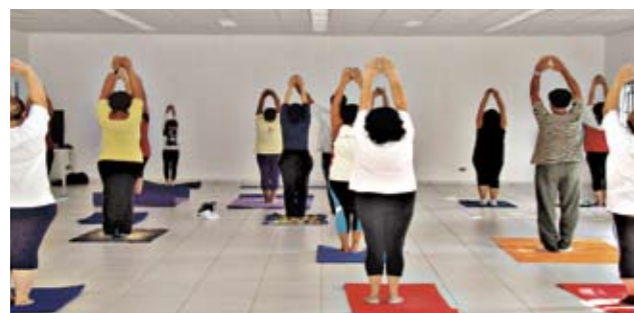
Aula de ioga: uma das mais concorridas

Interessado em fazer uma atividade cultural? Então reserve já uma vaga em um dos quinze cursos organizados pela Supervisão de Cultura da Subprefeitura. Gratuitos, muitos deles são bem concorridos, por isso é bom se apressar, pois as inscrições já estão abertas. Mais informações pelo tel. 3397-0896 ou na Subprefeitura, na avenida do Oratório, 172. Confira algumas opções: