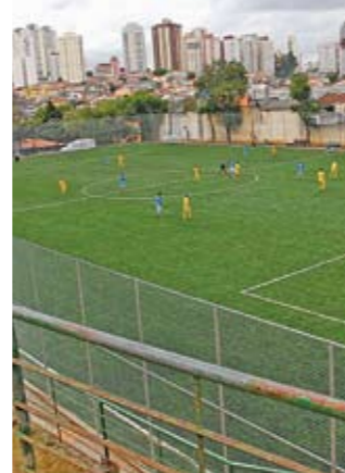
Campo tem 100m x 55m e nova iluminação

Foram montados nove jardins, com artistas e paisagistas brasileiros e franceses. A mostra pode ser vista todos os dias, das 5h às 22h. A entrada é gratuita. O MAM fica no Parque do Ibirapuera, na avenida Pedro Álvares, portão 3.