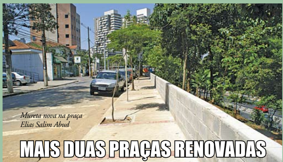
Mureta nova na praça Elias Salim Abud