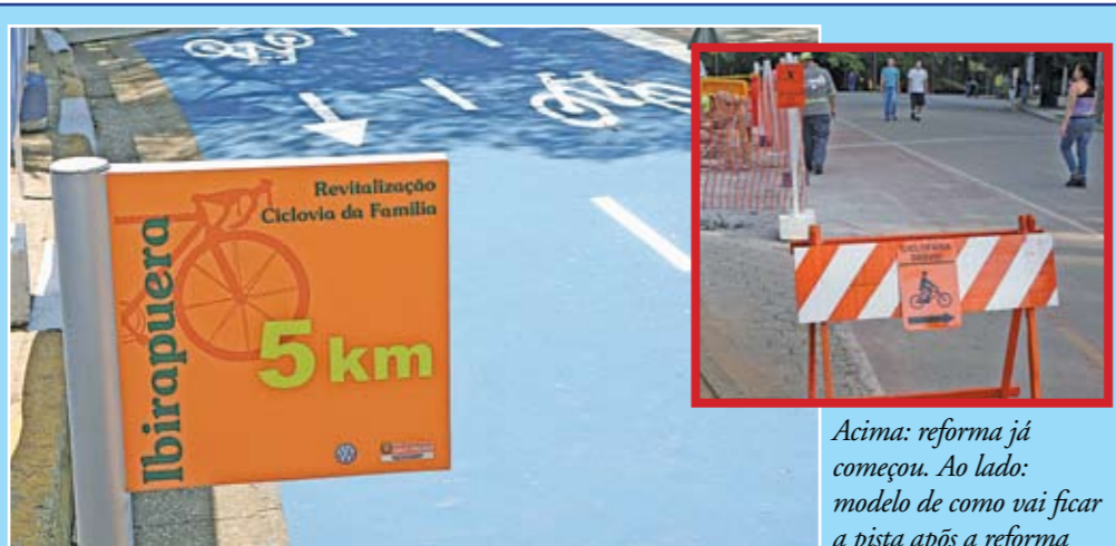
Acima: reforma já começou. Ao lado: modelo de como vai ficar a pista após a reforma