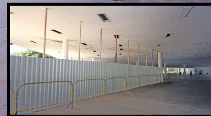
Área interditada: já em obras

P ara os frequentadores do Parque do Ibirapuera, a Marquise é ponto de encontro. É, também, o lugar preferido dos skatistas, patinadores e ciclistas por causa do tipo de piso que tem. Mas de uns tempos para cá, apareceram muitas rachaduras no teto. Para restaurar a Marquise, construída em 1954 por Oscar Niemeyer e que se tornou em um símbolo da arquitetura brasileira moderna, a Secretaria Municipal de Verde e Meio Ambiente já iniciou a reforma. Além da impermeabilização da laje e da troca das luminárias, será feita também a recuperação do piso, que está com muitos buracos. É a primeira vez que a marquise será reformada. Não é uma obra fácil. Deve demorar quase dois anos.