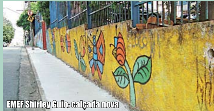
EMEF Shirley Guio: calçada nova

A Subprefeitura está promovendo uma reforma geral nas calçadas, travessas e escadarias da região. Como parte do PEC - Programa Emergencial de Calçadas, algumas escolas, UBSs e hospital ganharão novo passeio em pouco tempo. Além disso, três travessas e uma via de pedestres também receberão nova pavimentação em concreto, totalizando quase um quilômetro de asfalto novo. A mudança já pode ser observada na calçada novinha da EMEF Shirley Guio, na rua Cristóvão Lins, 611, Vila Isolina Mazzei, distrito de Vila Guilherme. Todas as obras devem estar concluídas até o final do ano.