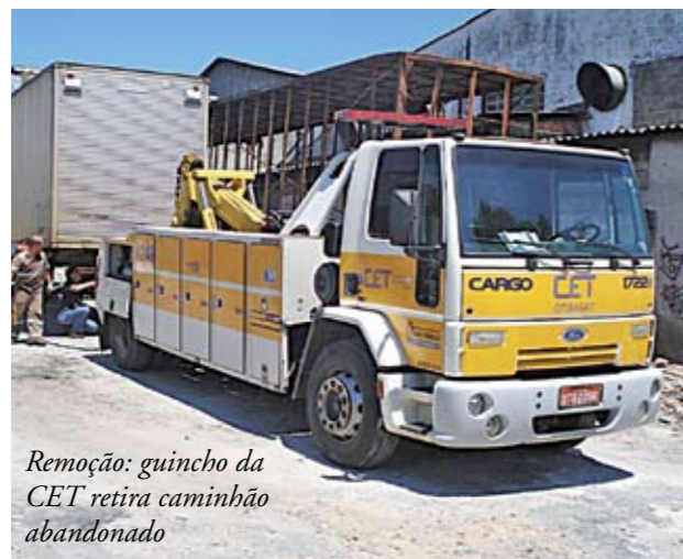
Remoção: guincho da CET retira caminhão abandonado

A Subprefeitura Vila Maria/Vila Guilherme está de olho nos carros abandonados que atrapalham o trânsito de carros e pedestres. Depois de cinco dias parado no mesmo lugar, um carro já pode ser considerado abandonado e retirado de onde está. Em setembro, três caminhões de grande porte foram removidos com a ajuda da Companhia de Engenharia de Tráfego (CET). Para ter seu veículo de volta, o proprietário precisa saldar possíveis pendências como multas de trânsito e licenciamento atrasado.