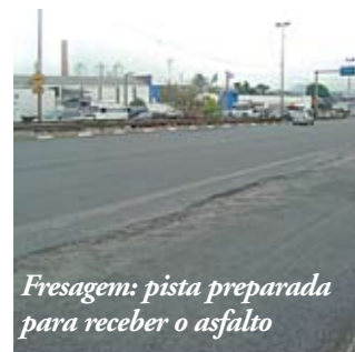
Fresagem: pista preparada para receber o asfalto

Todo ano era a mesma coisa: bastava chover para as duas faixas da direita na avenida Educador Paulo Freire ficarem alagadas. Isso acontecia devido a um desnível na pista. Desde março, a Subprefeitura vem trabalhando para resolver este problema. Foi construída uma canaleta lateral que facilita o escoamento da água. Agora estão em fase de finalização as obras de nivelamento. Além disso, a avenida ganhou 150 metros de guias e sarjetas de um dos lados da pista. Terminada esta parte, a outra lateral receberá o mesmo tratamento. As obras nas pistas ficarão prontas em julho.