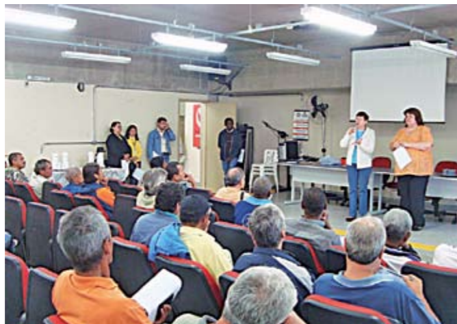
Treinamento: novos zeladores de praça recebem curso de capacitação