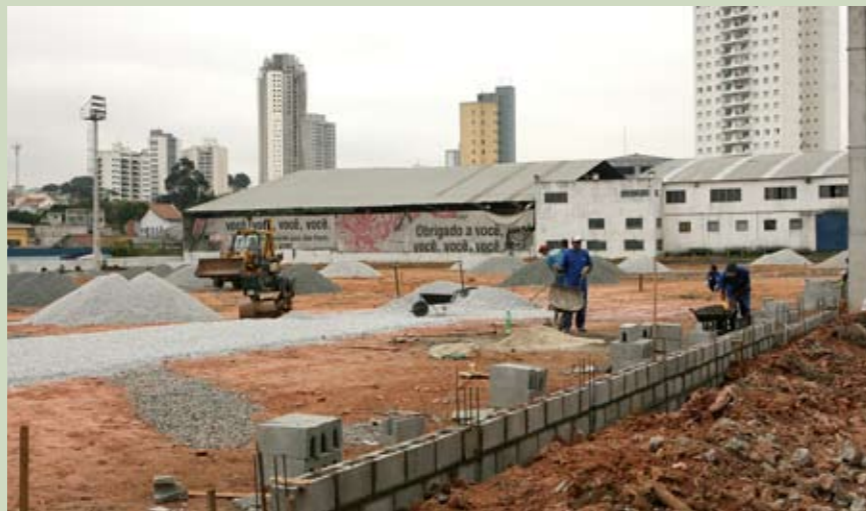
Tamanho oficial: campo de futebol em construção terá medidas recomendadas pela Fifa

As obras não param no CDC Cecília Meirelles. A sede social está passando por reforma e um novo campo de futebol, com medidas oficiais da Fifa, de 100m x 70m, está em construção. O campo terá ainda alambrado e iluminação. Além disso, um moderno sistema de drenagem está sendo instalado. A água captada será reutilizada na limpeza do clube. As atividades no CDC Cecília Meirelles são coordenadas em parceria com a ONG da Escola de Samba Unidos de Vila Maria e as aulas de futebol atraem cerca de 120 garotos de 10 a 17 anos. As obras devem ser concluídas em setembro. O CDC Cecília Meirelles fica na rua Soldado Anésio Antão Ferreira, 31, no Parque Novo Mundo, Vila Maria.