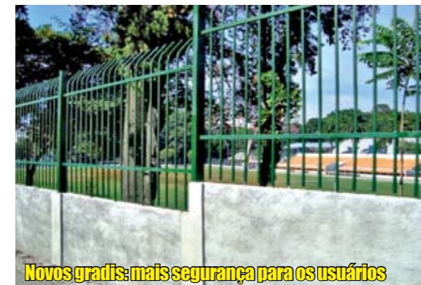
Novos gradis: mais segurança para os usuários

Desde o ano passado, o Clube Escola Vila Maria vem passando por obras. Agora, está pronto. O muro que contorna o clube foi totalmente substituído por gradis. E um outro muro, este de arrimo, foi erguido ao lado da pista de caminhada, próximo ao cruzamento das ruas José Maria Barroso com Luis Pedrosa. O ponto sofria com a erosão do solo e havia risco de desabamento sobre a pista. Também foi construída uma pequena escadaria, chamada de hidráulica, que serve para escoar a água das chuvas. Lá dentro, paredes e corredores receberam pintura caprichada. Na piscina, foi instalado um gradil para drenagem pluvial. Já a quadra poliesportiva ganhou cobertura e nova sinalização. O Clube Escola Vila Maria fica na praça Jânio Quadros, 150, e mantém sua programação fixa divulgada regularmente pelo site da Subprefeitura Vila Maria/Vila Guilherme: http://vilamaria-vilaguilherme.prefeitura.sp.gov.br .