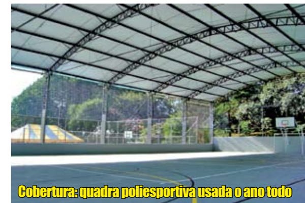
Cobertura: quadra poliesportiva usada o ano todo