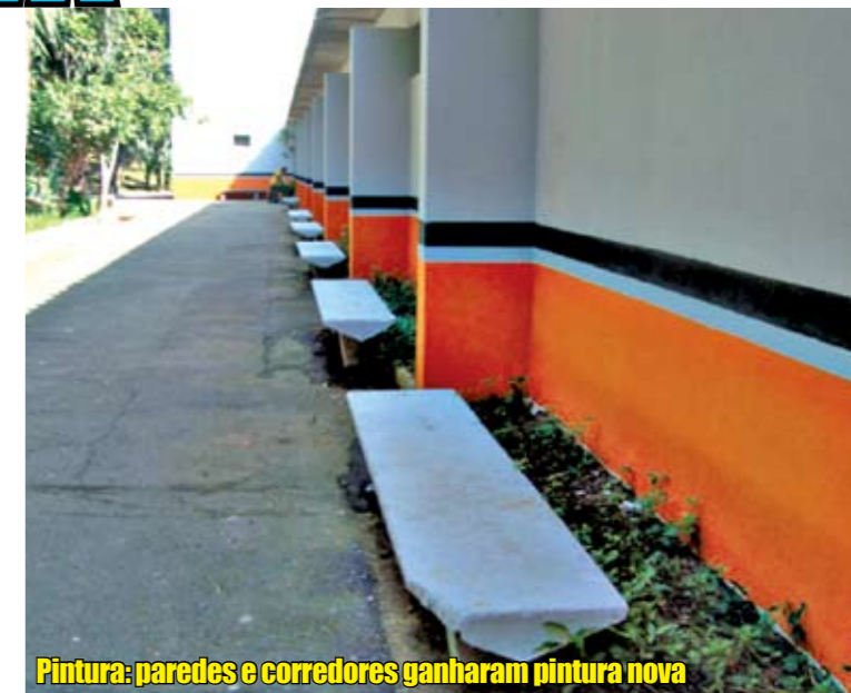
Pintura: paredes e corredores ganharam pintura nova