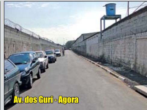
Av. dos Guri - Agora