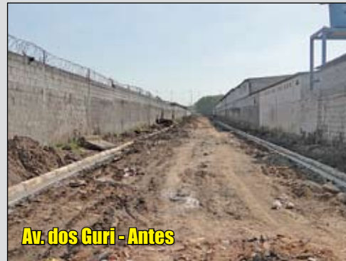
Av. dos Guri - Antes

estão passando por obras. Na Vila Jacuí, a rua Jacinto José Fagundes ganhou 135 metros de asfalto e a avenida dos Guris, 310 metros. Em São Miguel, a rua Parioto recebeu asfalto em toda sua extensão, 50 metros.