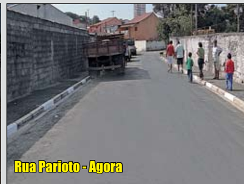
Rua Parioto - Agora