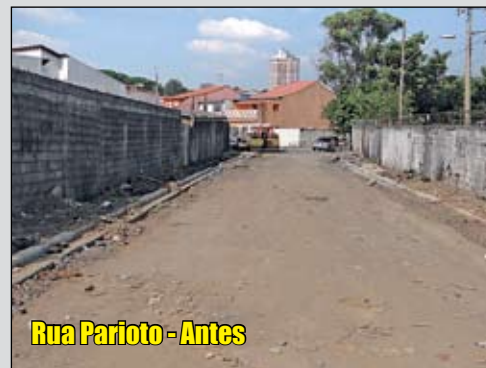
Rua Parioto - Antes