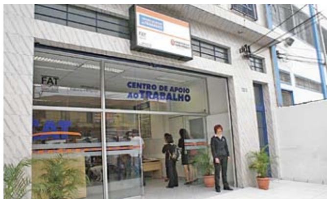
CAT São Mateus: cursos e oportunidades de emprego