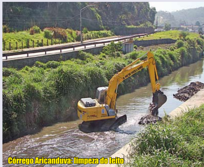
Córrego Aricanduva: limpeza do leito

Com as chuvas de verão chegando, nossas equipes estão redobrando o trabalho de prevenção de enchentes na região. Em outubro, nossa coordenação de obras, junto com técnicos do Departamento de Águas e Energia Elétrica (DAEE), do Governo do Estado de São Paulo, vistoriou o córrego Aricanduva e o riacho dos Machados para identificar os pontos que precisam ser desassoreados, ou seja, de onde devem ser tirados os detritos que se depositam no leito para dar mais vazão às águas. O DAEE empresta as máquinas e a execução do serviço fica a cargo da Subprefeitura de São Mateus. Além desse serviço, foi reforçado o trabalho de limpeza e manutenção do sistema de microdrenagem, composto por bueiros e ramais. A limpeza é feita com o hidrojato, um equipamento que utiliza um potente jato de água para desobstrução de galerias e bueiros. Também faz parte dessa programação a limpeza e remoção de entulho de todos os pisciões de nossa área.