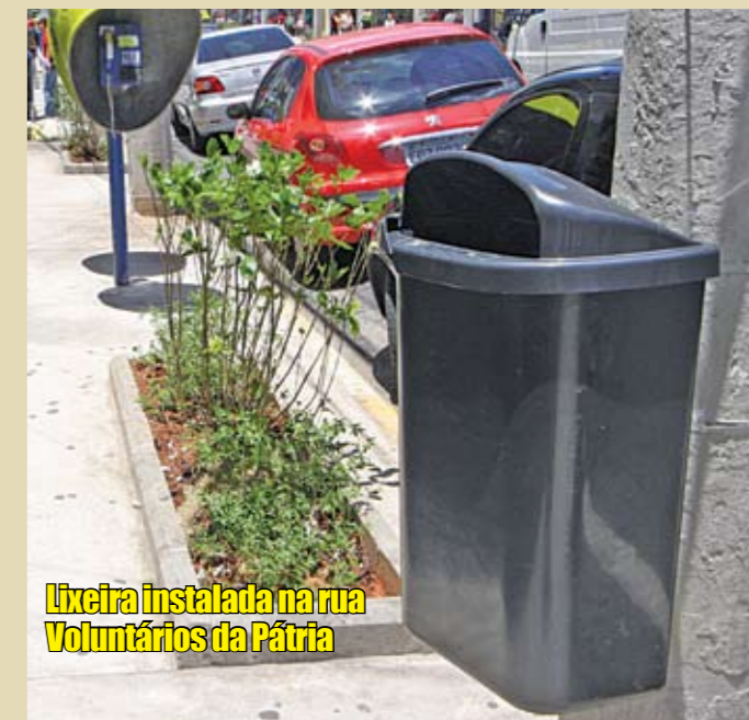
Lixeira instalada na rua Voluntários da Pátria

Para prevenir enchentes e os problemas causados pelas chuvas na nossa região, a Subprefeitura está trabalhando ainda mais. Foi intensificada a limpeza de córregos como o da rua Brazelisa Alves de Carvalho, próximo da avenida Brás Leme, em Santana. Este córrego tem cerca de 703 metros de extensão. Lá, está sendo utilizada uma escavadeira hidráulica com uma lança que alcança aproximadamente 16 metros de distância (foto acima), facilitando a limpeza neste local, de difícil acesso para máquinas comuns. Desde o início do ano a Subprefeitura já limpou 125.713 metros quadrados de córregos. Também para contribuir com a limpeza da região, a Subprefeitura instalou lixeiras nas principais ruas de Santana e do Tucuruvi. Ao todo, foram colocadas 500 unidades em postes do centro comercial, como na rua Voluntários da Pátria, avenida Cruzeiro do Sul, rua Leite de Moraes e avenida Tucuruvi. É sempre bom lembrar que é necessária a colaboração de todos para evitarmos as enchentes.