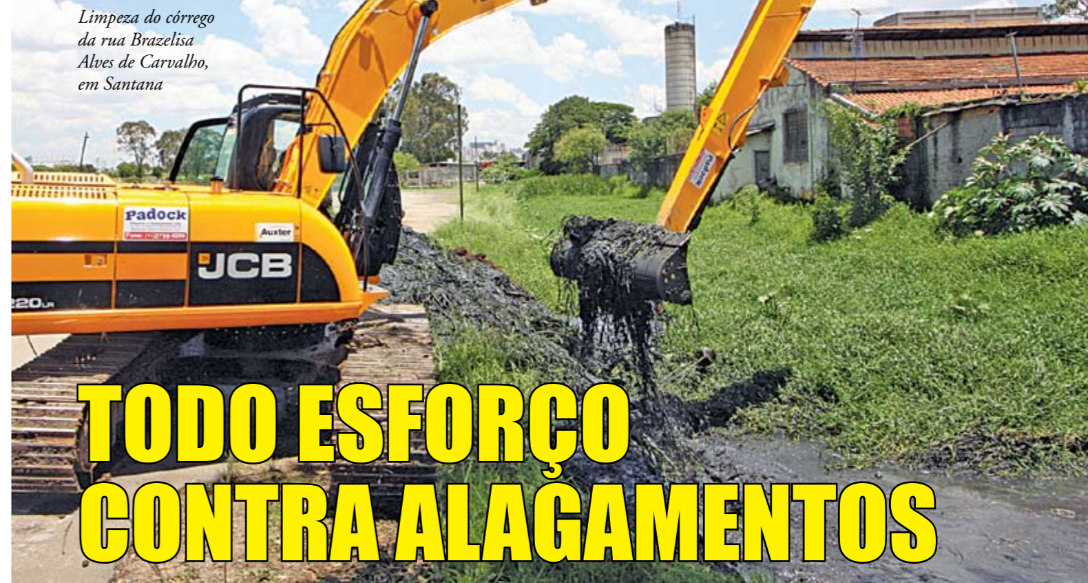
Limpeza do córrego da rua Brazelisa Alves de Carvalho, em Santana