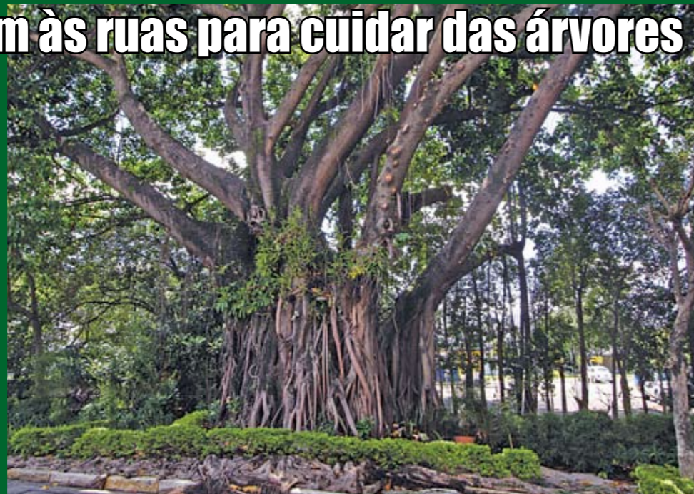
Árvores da região vão receber cuidados como poda e ampliação de canteiro

A partir de agora, as árvores da nossa região começam a ser observadas mais de perto. A Secretaria de Coordenação das Subprefeituras ampliou o programa Identidade Verde, que chega agora a 29 Subprefeituras da capital, incluindo Santana/Tucuruvi. Equipes de especialistas saem às ruas para fazer mapeamento e diagnóstico das árvores da região, verificando quais precisam de poda, de ampliação/reforma de canteiro ou até de remoção. Tudo para garantir a saúde das árvores e a segurança da população.