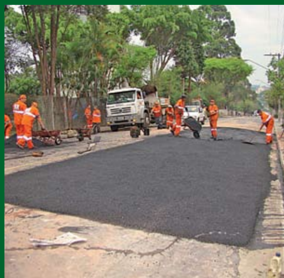
Equipes em ação em rua do Tucuruvi

Outra ação de combate a alagamentos na nossa região são os serviços de Tapa-Buraco. A partir de agora, as equipes levam, no máximo, 72 horas para tapar um buraco na pista depois de feita uma solicitação. Dessa forma, a Subprefeitura zerou os pedidos registrados pelo Serviço de Atendimento ao Cidadão (SAC) da Prefeitura. Em três meses, mais de 500 solicitações de reparos nas vias foram atendidas. Só em 2010, foram tapados 16.629 buracos nos três distritos que compõem a nossa região: Santana, Tucuruvi e Mandaqui.