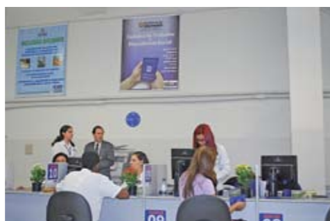
Atendimento ao público no CAT Santana

O Centro de Apoio ao Trabalho (CAT) Santana foi renovado e entregue, no fim de setembro, para a população. A Secretaria Municipal de Desenvolvimento Econômico e do Trabalho (Semdet) investiu na infraestrutura do local, melhorando as salas de atendimento, seleção e orientação para o trabalho, além dos laboratórios de informática. O CAT Santana fica na rua Voluntários da Pátria, 1.553, e atende de segunda a sexta, das 7h às 18h, e aos sábados, das 7h às 13h.