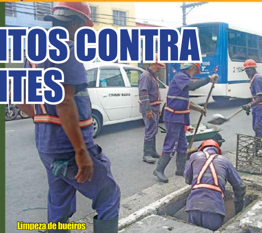
Limpeza de bueiros

Os distritos de Santana, Tucuruvi e Mandaqui estão aumentando cada vez mais seus trabalhos para prevenir os problemas causados pelas chuvas de verão na cidade. A Subprefeitura está com equipes saindo às ruas para realizar vários tipos de serviços. Estão sendo feitas podas de árvores, limpeza de córregos e de galerias, Operação Cata-Bagulho semanal, além da definição de ações conjuntas com empresas para coleta de lixo e varrição das ruas durante o período de chuvas. Também vem sendo elaborado um projeto para reforço de galerias de águas pluviais em 13 pontos críticos da região e está prevista a contratação de equipes de emergência para atuar em caso de enchentes. Mas tudo isso só funciona se a população colaborar, ensacando o lixo e respeitando os horários de coleta, e não jogando entulho nas ruas (o que dá multa de R$ 12 mil, além de apreensão do veículo). Móveis velhos devem ser entregues nas Operações Cata-Bagulho; restos de construção devem ser levados aos Ecopontos. Mais informações pelo telefone da Subprefeitura: 2987-3844.