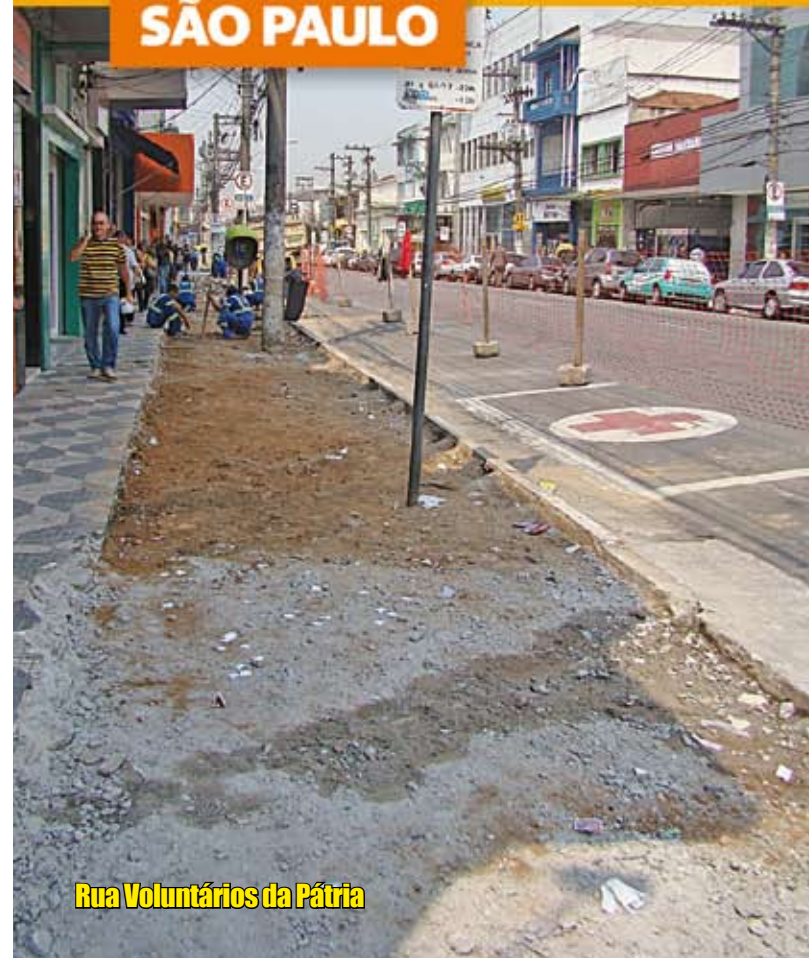
Rua Voluntários da Pátria