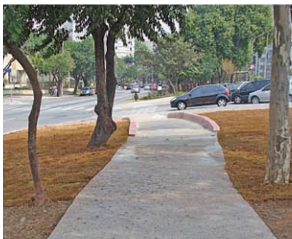
Pista de caminhada com rampas de acesso

Quem mora na nossa região pode reparar os investimentos feitos na avenida Brás Leme. Lá, foi construída uma pista de caminhada de 3,5 quilômetros (toda a extensão da avenida) e o canteiro central foi renovado pela Prefeitura recentemente. A Subprefeitura Santana/Tucuruvi/Mandaqui fez também mais dez rampas para pessoas com mobilidade reduzida no canteiro central, facilitando o acesso ao comércio da região, principalmente à rua Dr. César. Corrigiu imperfeições na pista de caminhada e plantou grama em uma área de 300 m 2 , aumentando a permeabilidade do solo e dando mais conforto para quem caminha no local.