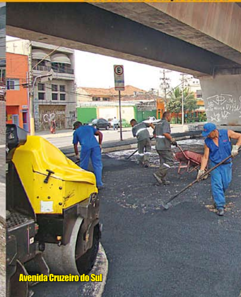
Avenida Cruzeiro do Sul