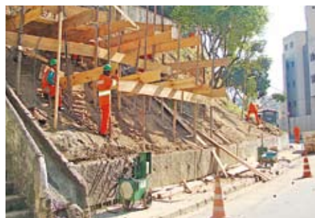
Obra de contenção no Tucuruvi

Uma área que sofreu desmoronamento no Tucuruvi começou a ser recuperada em agosto pela Subprefeitura. Trata-se de um trecho de 100 metros na rua Tranway, próximo da rua Araçoiaba da Serra, até a rua Paulo Maldí. Ali está sendo feito um talude de 4 a 6 metros de altura, além da contenção com tirantes de aço. Por fim, a área será gramada onde for possível, garantindo a permeabilidade no local. Também ali a Subprefeitura fará a reforma da escadaria da rua Araçoiaba da Serra e reconstruirá uma mureta e o alambrado, que caíram com o desabamento do barranco.