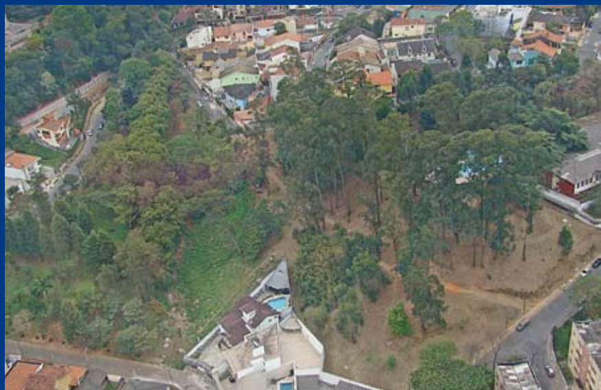
Praça Agostinho Nohama: área de 15 mil m 2 vai virar espaço de lazer

Os moradores do Mandaqui vão ganhar em breve uma área verde de 15 mil m 2 (maior que um campo de futebol) totalmente renovada. A praça Agostinho Nohama, entre as ruas Coronel João da Silva Feijó e Padre José Allamano, está passando por uma grande reforma: construção de calçadas e pista de caminhada, colocação de gradil e instalação de áreas de lazer (bancos, mesas, brinquedos infantis e aparelhos de ginástica). Também será feita uma galeria de águas pluviais para eliminar erosões e proteger a nascente do Córrego Buraco da Onça, que fica ali. E será feita a drenagem nos pés dos taludes, também para impedir erosões. Por fim, será plantada grama esmeralda e feito novo paisagismo no local.